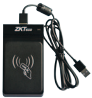
Enrolador de Tarjetas