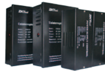
Fuente de Poder