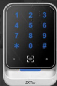
QR600 - HK