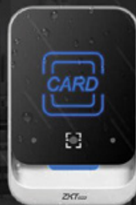
QR600 - H