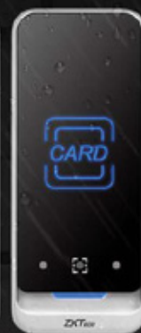
QR600 - V