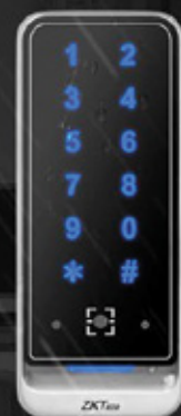
QR600 - VK